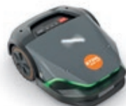
iMOW® 7 EVO (jusqu'à 5 000 m 2 )