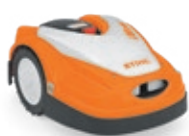
RMI 422 (de 50 à 800 m 2 )

Les iMOW® EVO sont des versions augmentées qui proposent plus d'options pour répondre aux besoins et désirs des jardiniers les plus exigeants : connectivité 4G, temps de tonte réduit, vitesse d'avancement élevée et pack LED avec matrice LED.