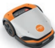
iMOW® 7 (jusqu'à 5 000 m 2 )