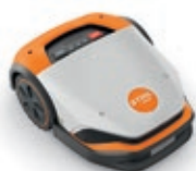
iMOW® 6 (jusqu'à 3 000 m 2 )