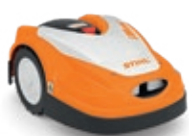
RMI 422 P (jusqu'à 1 500 m 2 )